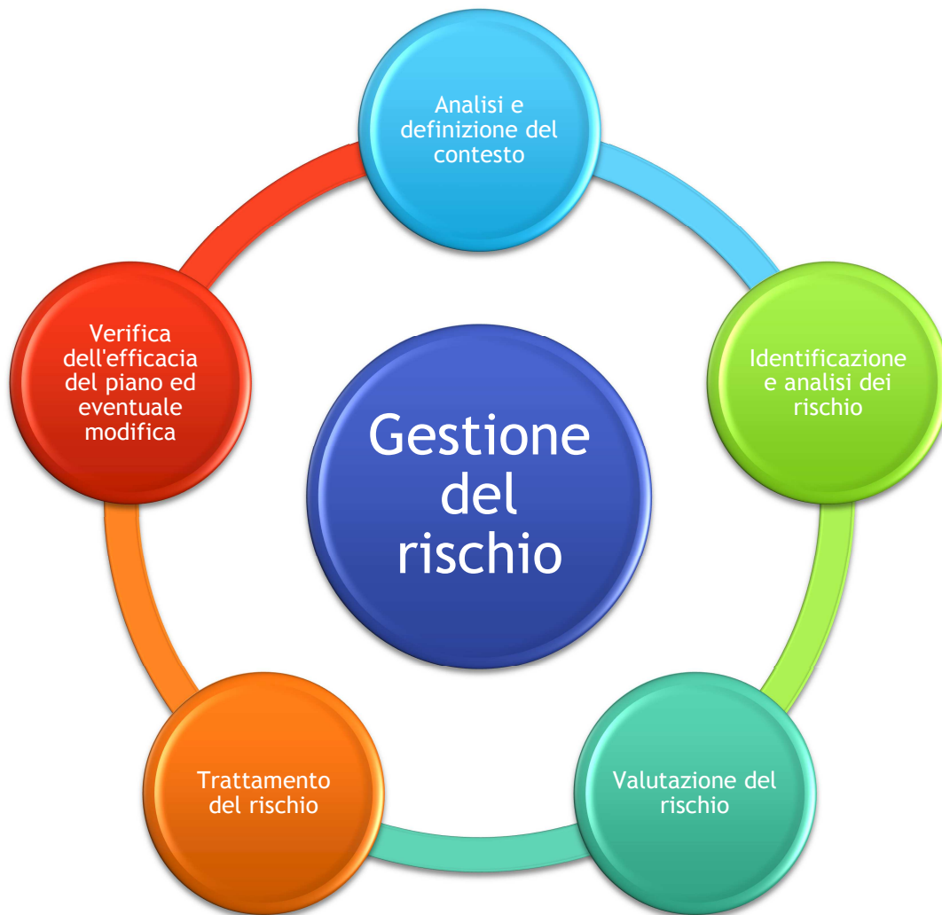
FIGURA 2 - LE FASI DEL PROCESSO DI RISK MANAGEMENT NELLE PREVISIONI DELLA LEGGE 190/2012